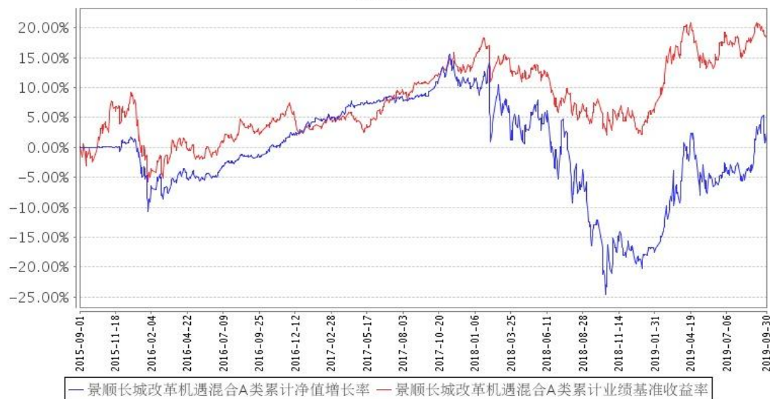
景顺长城改革机遇混合A类累计净值增长率与同期业绩比较基准收益率的历史走势对比图