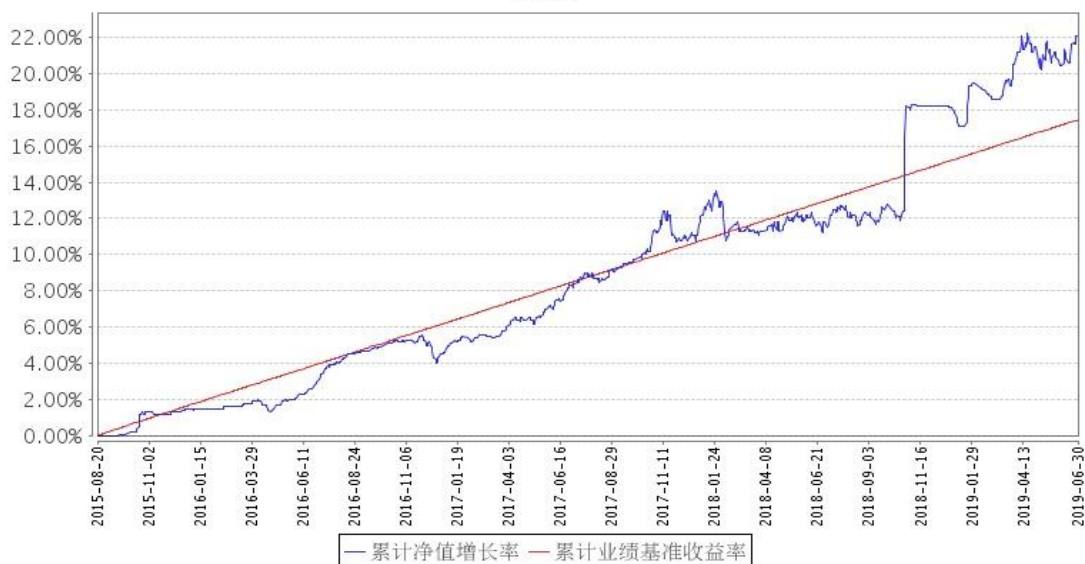
景顺长城泰和回报混合A累计净值增长率与同期业绩比较基准收益率的历史走势对比图