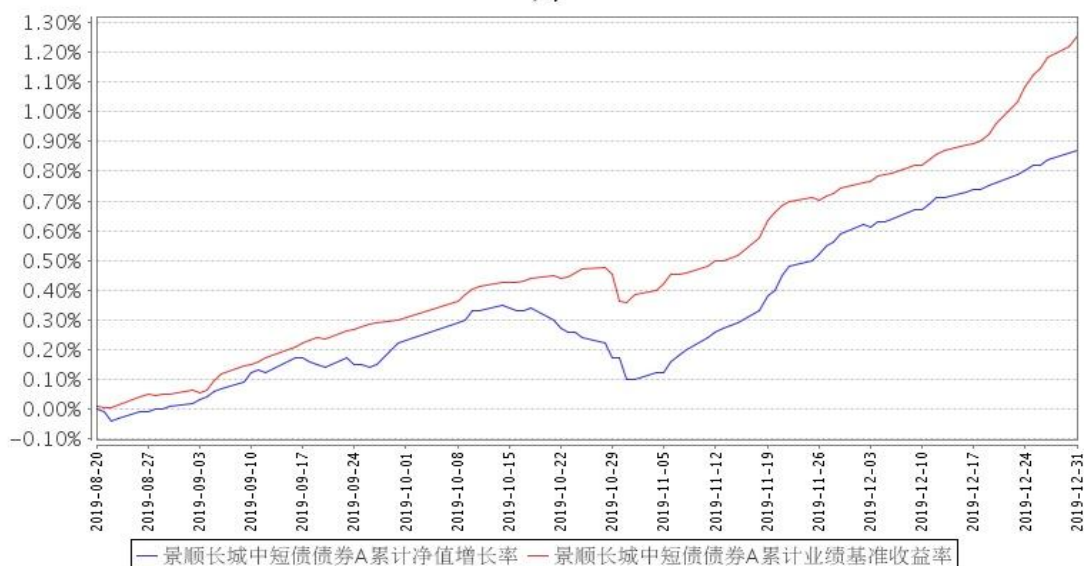
景顺长城中短债债券A累计净值增长率与同期业绩比较基准收益率的历史走势对比图