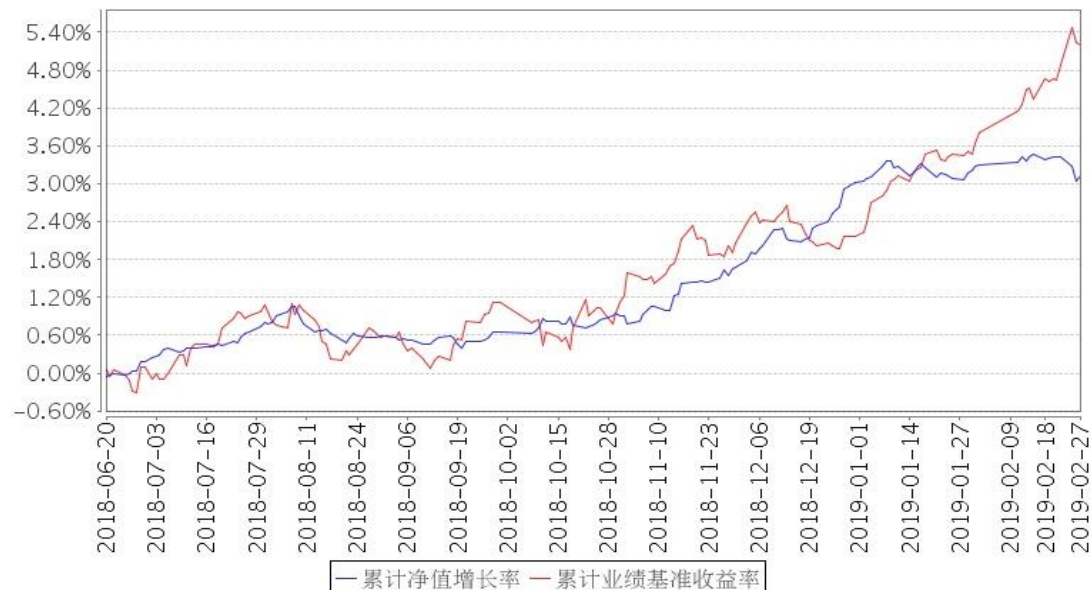
景顺长城景瑞双利债券累计净值增长率与同期业绩比较基准收益率的历史走势对比图