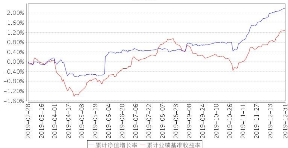
景顺长城政策性金融债债券型证券投资基金累计净值增长率与同期业绩比较基准收益率的历史走势对比图

注:2019年2月28日,景顺长城景瑞双利债券型证券投资基金转型为景顺长城政策性金融债债券型证券投资基金(以下简称“本基金”)。基金的投资组合比例为:本基金对债券资产的投资