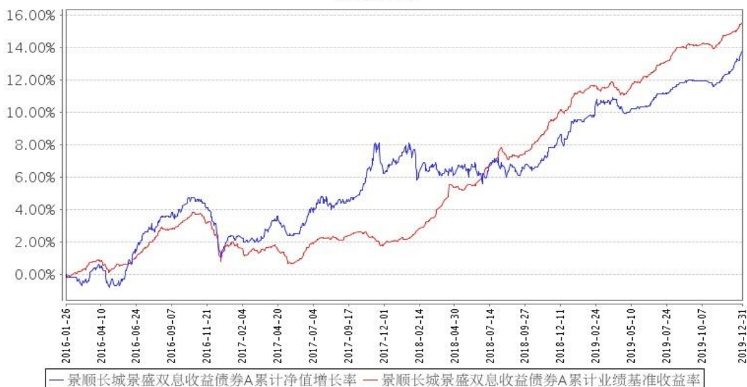
景顺长城景盛双息收益债券A累计净值增长率与同期业绩比较基准收益率的历史走势对比图