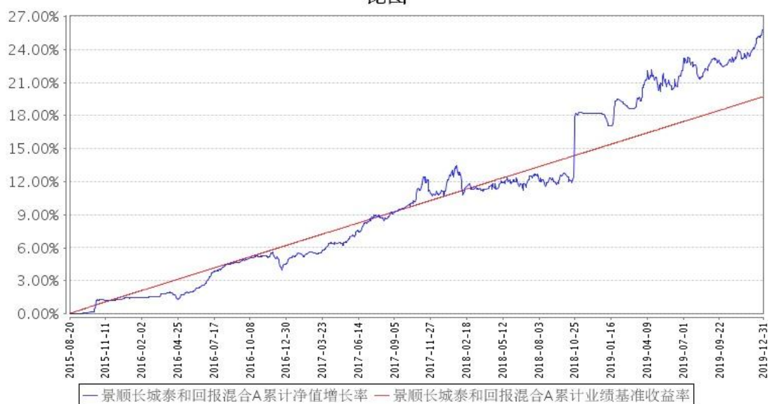
景顺长城泰和回报混合A累计净值增长率与同期业绩比较基准收益率的历史走势对比图